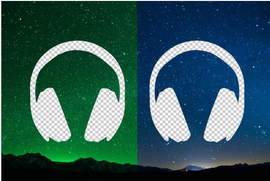
INDI GEST. Guia bàsica del vianant temporal.