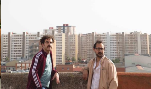
BARBA CORSINI, Un nou incendi .