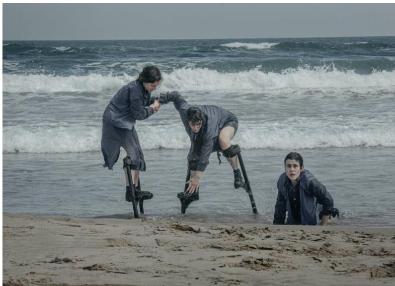
CIA. MADUIXA, Migrare .

Quatre dones i un espai buit minat d'obstacles i fronteres invisibles, d'odis irracionals i de prejudicis. Van haver de deixar la seua terra d'origen i el país d'arribada les rebutja. L'espai s'ha convertit en un no-espai. Elles el transiten buscant el seu lloc. Un lloc on poder viure, on arrelar, un lloc al qual anomenar «llar». Només demanen això i lluitaran per aconseguir-ho. Una peça de dansa sobre xanques. Equilibri i poesia en moviment que apel·la les emocions dels espectadors. SUPORT A LA CREACIÓ 2021