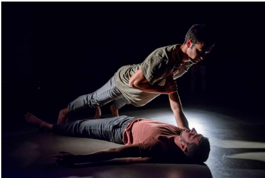
COMPANYIA DE CIRC «eia», NUYE.