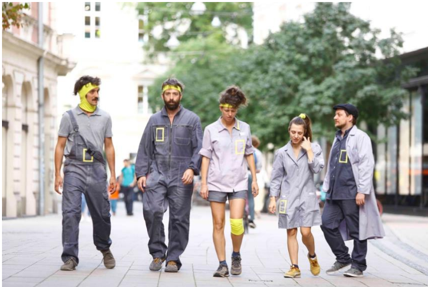
ELÉCTRICO 28, [ The Frame ].

Espectacle que proposa plantar-se davant el transcurs de la vida urbana per observar-la. Hi ha cadires, mirades, paraules, cartells, veus, sons, asfalt, algun arbre i moltes altres coses. Hi ha molts personatges, quatre dels quals entrenats en les disciplines de l'observació i l'ordenació de qualsevol cosa i que se sotmeten al vertigen del directe, amb l'objectiu de capturar tot el que succeeix. No hi ha argument. No hi ha final. [ The Frame ] abraça molts espais —lúdic, poètic, la sorpresa i l'acció espontània, la trobada—, però, sobretot, és una mirada que, travessant allò ordinari, allò banal i allò general, descobreix allò extraordinari, allò especial, allò únic. SUPORT A LA CREACIÓ 2020