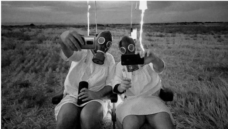
DESKONEKTAR. Deskonektar .

Què crea més serotonina: un like digital o un somriure al carrer? Com han canviat els nostres hàbits? Quines conseqüències tenen per a la nostra salut física i emocional? Acció de carrer on tres personatges anònims i imprevisibles deambulen en un espai híbrid físic/digital, i combinen la comunicació amb el públic a través del teatre físic, gestual i de moviment, amb l'ús d'eines i accions tecnològiques: mòbils, apps, càmeres, codis QR, sessions de selfies, tutorials d'abraçades, balls tik tok, situacions i converses absurdes, continguts audiovisuals en directe... El carrer és ben viu i mai saps què pot acabar passant.