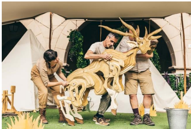
SANDAL PRODUCCIONS, Animalia, Inc.

L'equip d' Animalia, Inc. planta el seu campament. Mentre els biòlegs desenvolupen les seves tasques rutinàries, alguna cosa fa neguitejar els animals. Poden confiar en aquests humans? A partir del teatre físic i gestual, la manipulació dels titelles i l'humor, l'espectacle recrea els campaments de naturalistes que estudien el comportament dels animals. Una al·legoria sobre la convivència entre espècies i una reflexió crítica sobre la preeminència de l'espècie humana sobre la resta de criatures del planeta.