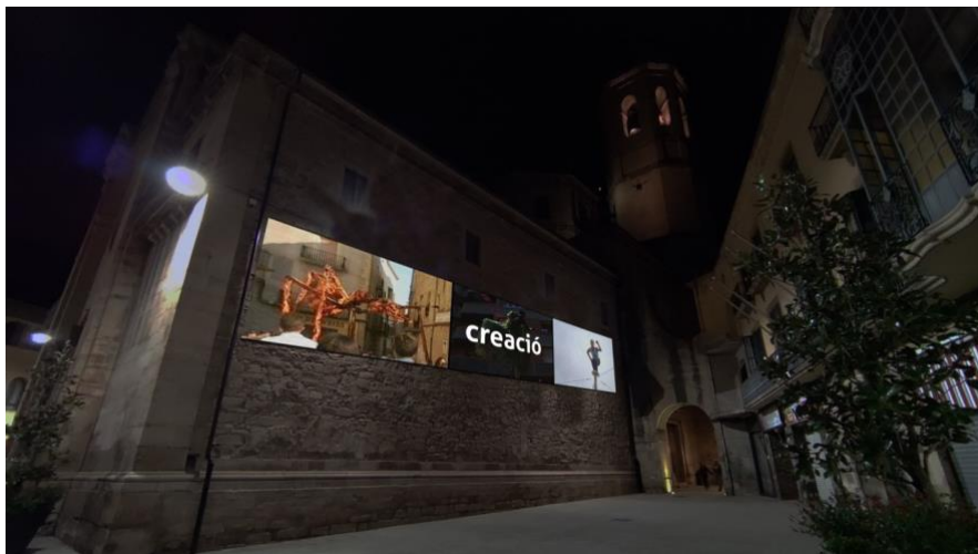
CALIDOS, 40 anys vivint la Fira.

Peça audiovisual en format multipantalla panoràmica que fa un recorregut atemporal pels 40 anys d'història de FiraTàrrrega, trencant la lògica de la cronologia. Una mirada contemporània, conceptual, molt centrada en la dimensió humana de l'esdeveniment i posant l'accent en la reivindicació de l'espai públic i en la universalitat de l'experiència cultural des d'una vessant absolutament local. Un homenatge a la ciutadania que, des de l'anonimat i des del seu origen, ha estat la veritable protagonista de la Fira.