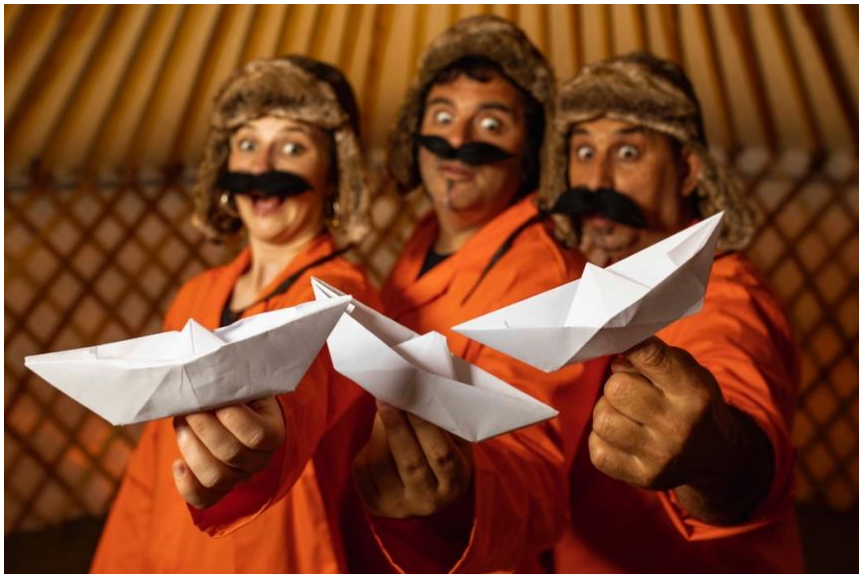
TOMBS CREATIUS, Secrets .

Instal·lació de jocs plantejada com un espectacle vivencial de carrer que proposa al públic de totes les edats ser protagonista de la seva pròpia història, a través d'un recorregut en la recerca d'un gran secret, que només descobriran jugant i deixant-se emportar per la curiositat. Artesania i tecnologia es combinen per oferir una experiència personalitzada, emocionant, intensa i intransferible. Secrets no es pot veure, s'ha de viure. SUPPORT A LA CREACIÓ 2020-2021