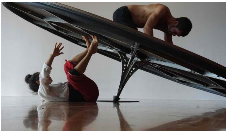
HAA COLLECTIVE, Picaderø .

Experiència transdisciplinària, basada en el circ contemporani, el paisatge sonor i la instal·lació. Un escenari mòbil inspirat en la forma i el moviment d'una baldufa que esdevé instrument musical mentre l'artista sonor i els performers interactuen. El seu moviment rotatori i circular ens dibuixa el pas del temps. També es pot identificar com un artefacte lúdic o esdevenir el reflex d'un picador eqüestre on els equins són lligats per a la seva domesticació. La recerca de l'equilibri en la inestabilitat, l'acceptació dels límits per trobar la llibertat. SUPORT A LA CREACIÓ 2020-2021