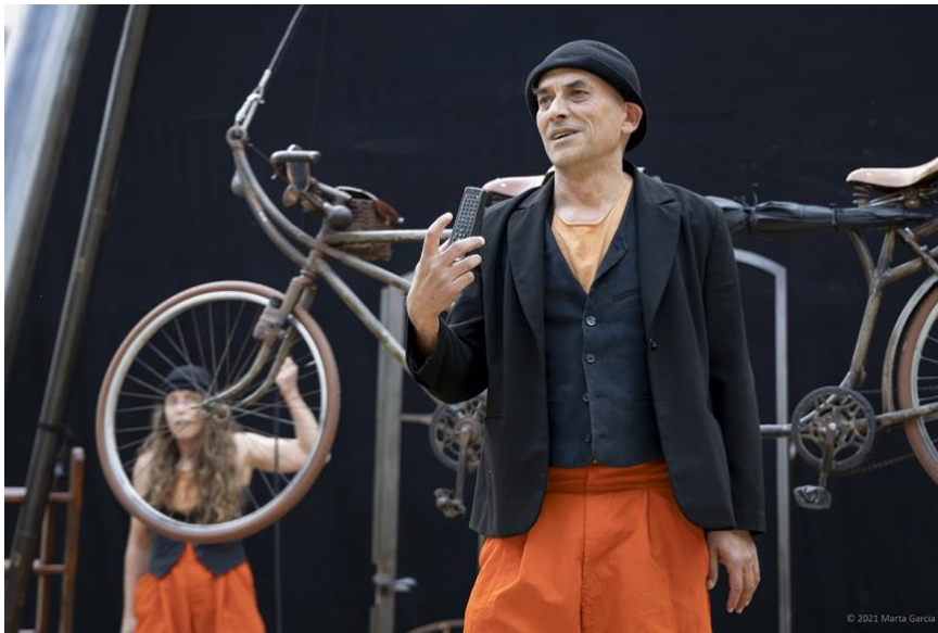
LEANDRE, Fly me to the Moon .

Un tàndem, la lluna, un viatge. Duo de clown. Dos funambulistes del desastre i la poesia emprenen un viatge possible cap a la lluna, el lloc que coneixíem tan bé quan érem petits. Una bicicleta voladora, fusta, ferro, pols, sabates grosses i barrets fins a les celles. La proesa de dos innocents. La proesa del somiador. I tot el que pot passar en el trajecte entre aquí i allà. Un moment ple de coses senzilles: riure, escoltar, sorprendre's, jugar. Un regal per als sentits.