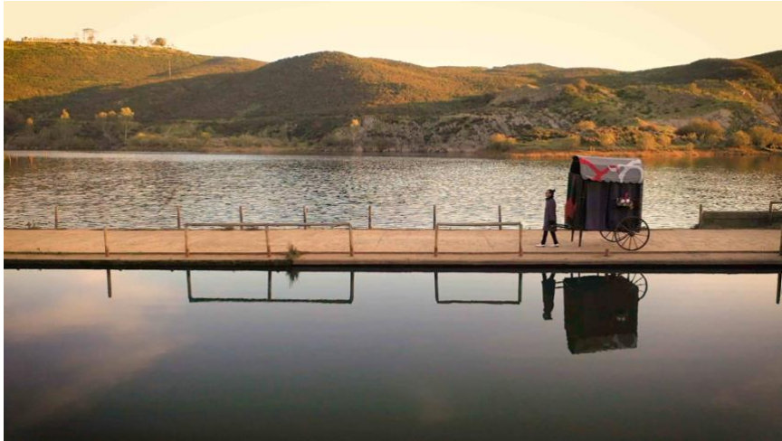
CHICHARRÓN CIRCO FLAMENCO, Sin ojana .