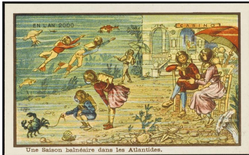
PIERRE SAUVAGEOT. Water music.